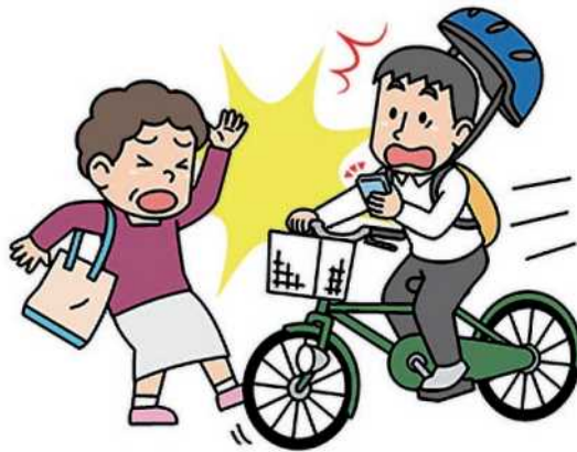
ながらスマホはしない！