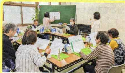
コスモスの会 (東北地区)

中央区内のサロンでは、定期的な集いの場として、温かな交流や仲間同士の気に掛け合う関係性が生まれています。今回は、訪問させていただいた一部のサロンをご紹介します。