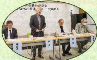
▲「東北地区社協総会」(東北地区)