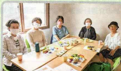
ライラックサロン (東北地区)

ハンドベルの演奏を中心とした交流の場で、和やかな中にも、真剣な面持ちで練習に臨まれていました。