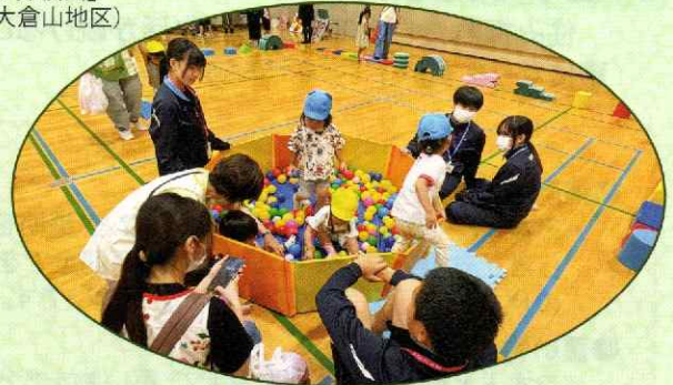
▲「ちびっこサマーランド」(幌西地区)