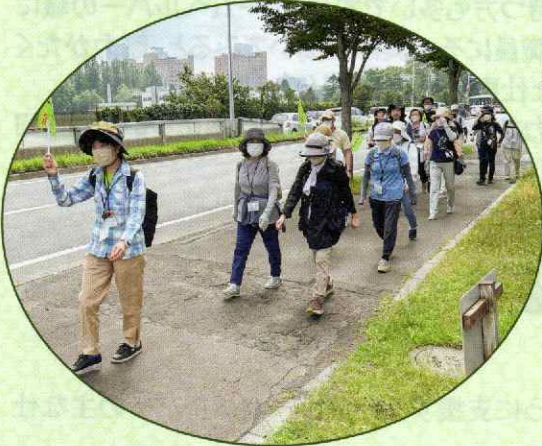
▲「桑園ウォーキング」(桑園地区)

4月から各地区で行われた行事等をご紹介します。見守り活動の一環として、集合型の事業も新型コロナウイルスの感染法上の位置づけも変わったため再開されています。(順不同)