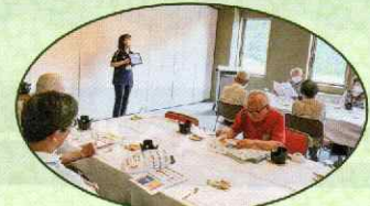
▲「日帰り温泉旅行」(東地区)