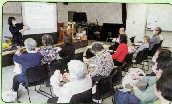
▲楽しみながらタオル体操を行いました

教室終了後は、引き続き、同じ会場で、老人クラブ・苗穂洋々会の例会が開かれ、冒頭、最近のニュース等の話題を共有されている和やかな雰囲気も拝見できました。