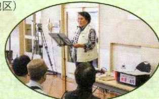
▲「健康づくり教室」(曙地区)