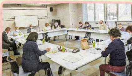
シニアサロンひだまり (大通地区)

中央区内で一番新しいサロンです。月1回日曜日にお茶を飲みながら、おしゃべりを楽しんでいます。