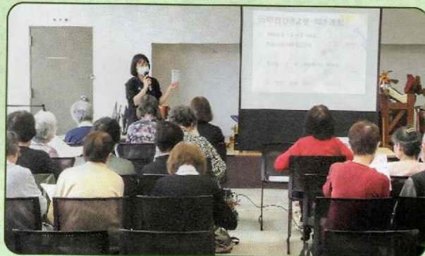
▲講話には真剣な表情で耳を傾けます