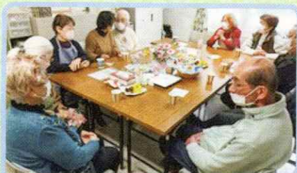
きだバレス手作りカフェ「てくてく」(曙地区)

気楽なおしゃべりする会として、お菓子交換も、皆さんのお楽しみの一つとなっている様子です。