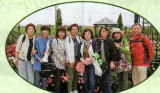
▲「やまなみ探検会」 (宮の森大倉山地区)