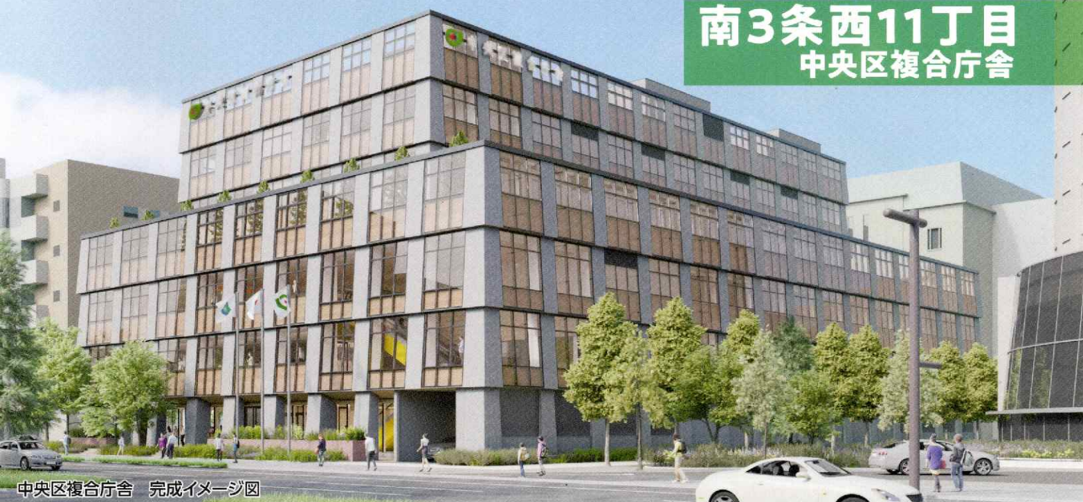
中央区複合庁舎 完成イメージ図