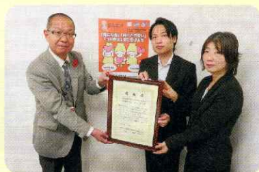
10月17日 明治安田生命保険相互会社様 (105,100円)