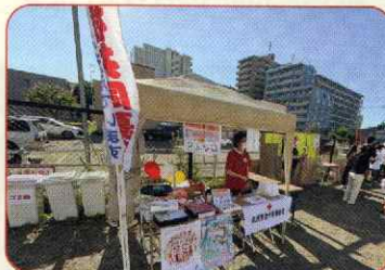
8月11日(日) サマーフェスタ苗穂&子ども盆踊り