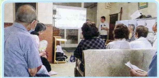
おしゃべりサロン（山鼻地区）