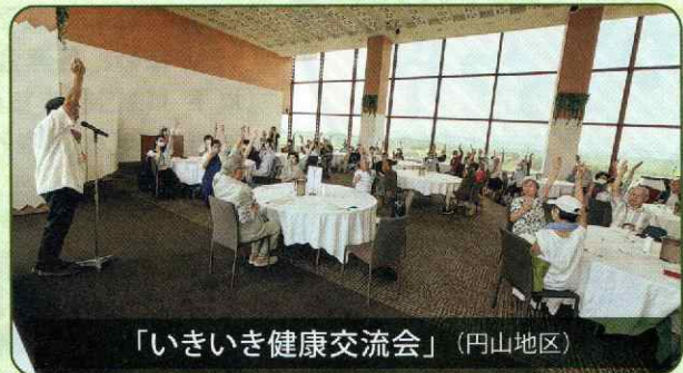
「いきいき健康交流会」(円山地区)

夏の恒例行事、コロナ禍もあり5年ぶりに開催された行事など様々です。ぜひお近くの行事に参加してみませんか。問い合わせは巻末をご参照ください。