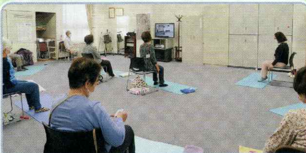
ふれあいグループ（桑園地区）