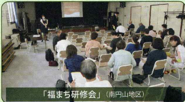
「福まち研修会」(南円山地区)