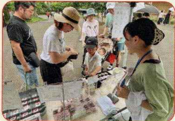
8月14日(水)・15日(木) 円山動物園