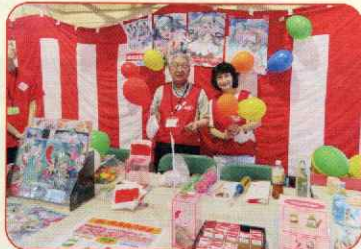
8月4日(日) 曙サマーフェスティバル 2024in 曙

赤い羽根共同募金の普及、啓発活動と周知を目的として、円山動物園、地域の行事、学校の行事などでイベント募金を実施しました。中央区ボランティア連絡会の皆様にもお手伝いいただきました。皆様のご協力に感謝申し上げます。