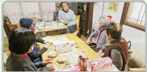
曙お茶の間わきあいあい（曙地区）