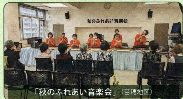
「秋のふれあい音楽会」(苗穂地区)