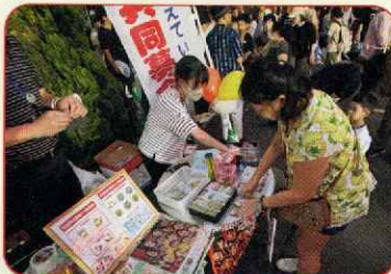
8月15日(木) 豊水ふれあい盆踊り大会