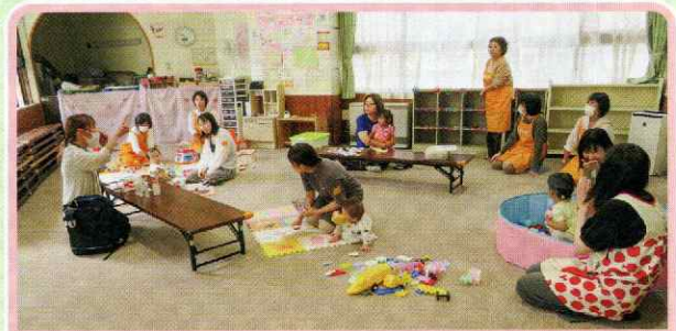
桑園地区子育てサロンすくすく（桑園地区）

今後も順次、皆さまのサロンや集いの場におじゃまさせていただき、開催の様子をお知らせしていきます。