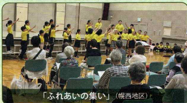
「ふれあいの集い」(梶西地区)