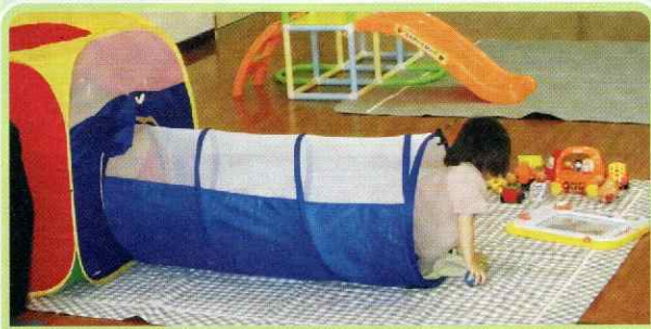
曙ほのぼの子育てルーム（曙地区）