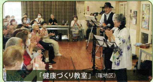
「健康づくり教室」(曙地区)