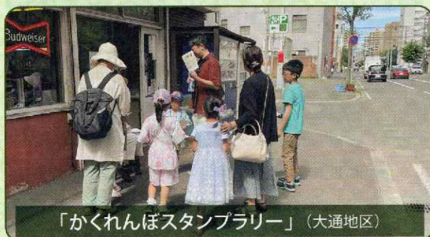
「かくれんぼスタンプラリー」(大通地区)