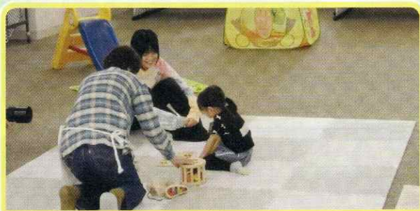
東地区なかよし広場（東地区）

中央区内のサロンでは、定期的な集いの場として、温かな交流や仲間同士の気に掛け合う関係性が生まれています。今回は、東地区の「東地区なかよし広場」、曙地区の「曙お茶の間わきあいあい」「曙ほのぼの子育てルーム」、山鼻地区の「おしゃべりサロン」、桑園地区の「ふれあいグループ」「桑園地区子育てサロンすくすく」をご紹介します。