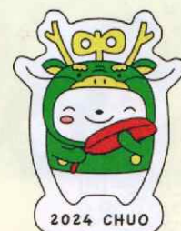
中央区限定ピンバッジ (500円以上の募金で1つ進呈)

中央区共同募金委員会では、毎年、募金活動を身近なものに感じていただくために、札幌市中央区役所地域振興課にご協力をいただき、ピンバッジを作成しています。令和6年度は今年の干支である辰年にちなんで、辰の被り物を身に着けた中央区のマスコットキャラクター「中ウォークン」が赤い羽根を携え、赤い羽根共同募金に取り組む様子をイメージし作成しております。ご協力をお願いします。