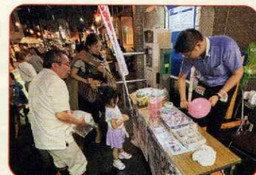
8月13日(火) 円山夏祭り子ども盆踊り大会