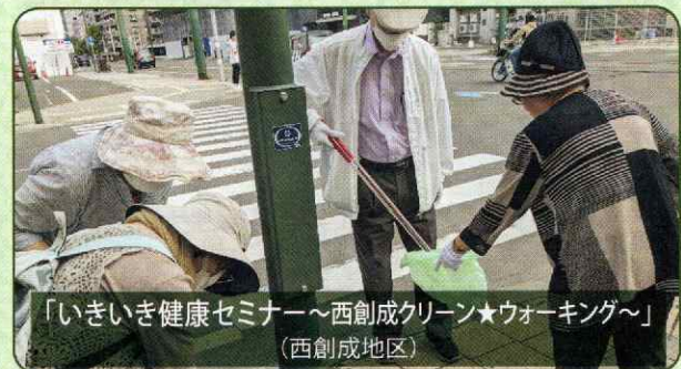
「いきいき健康セミナー～西創成クリーン★ウォーキング～」 (西創成地区)