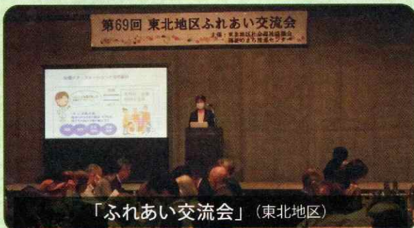
「ふれあい交流会」(東北地区)