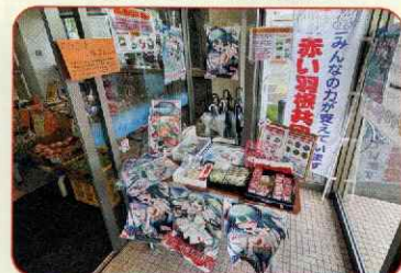
9月21日(土) 心福マルシェ