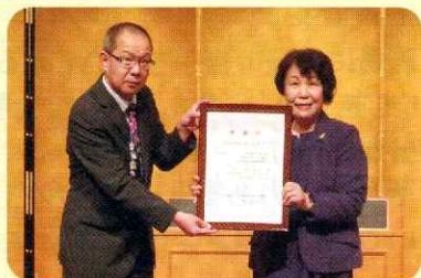
9月18日 中央区西連合町内会女性部様 (50,000円)

※ご寄付は、中央区内の「ふれあい・いきいきサロン」の支援や、地域福祉活動に活用させていただきます。