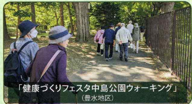
「健康づくりフェスタ中島公園ウォーキング」 (豊水地区)