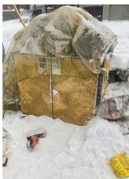
数年前の年始のごみボックスの写真です

*ごみボックス周りの積雪により、組み立てや折り畳みに苦労なさっていることと思います。ちょっとした隙間を狙い、カラスが生ゴミを引き出し散らかしますので、組み立て時には隙間がないようご協力よろしくをお願いいたします。降雪時に雪が挟まり畳むことが難しい場合は、無理をしなくとも結構だと思っています。