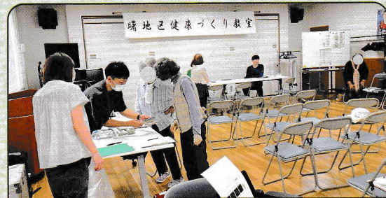
「健康づくり教室」（曙地区）