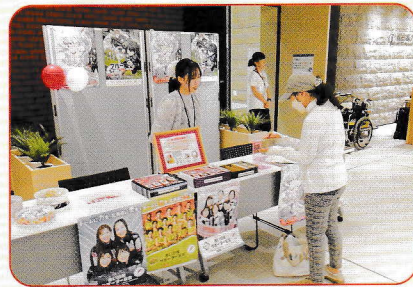
8月30日(土) ウェルネスフェスタ 2025 in ちゅうおう