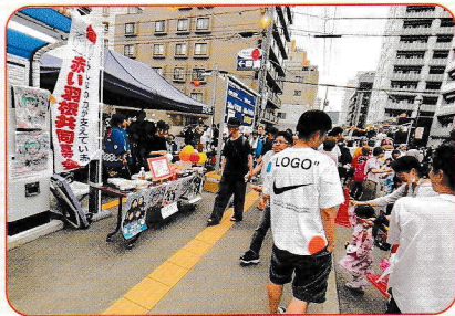
8月9日(土)・10日(日) 円山夏祭り子ども盆踊り大会