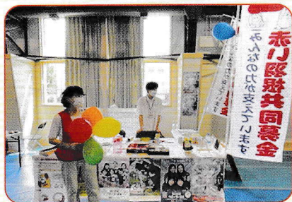
8月3日(日) サマーフェスティバル 2025in 曙

赤い羽根共同募金の普及、啓発活動と周知を目的として、円山動物園、地域の行事、学校の行事などでイベント募金を実施しました。中央区ボランティア連絡会の皆様にもお手伝いいただきました。皆様のご協力に感謝申し上げます。