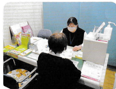
来所での相談も可能です

要介護認定の要支援1・2となった方、介護予防・日常生活支援総合事業の事業対象者の方が、必要なサービスを受けられるような支援。