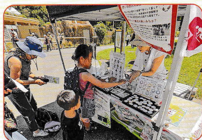
8月13日(水)・14日(木)・15日(金) 円山動物園