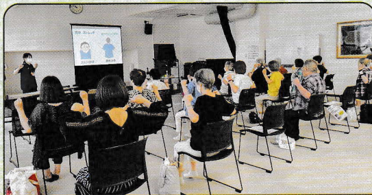
「健康づくり教室」（苗穂地区）