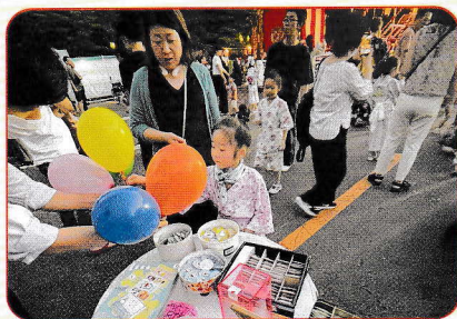
8月14日(木)・15日(金) 豊水ふれあい盆踊り大会