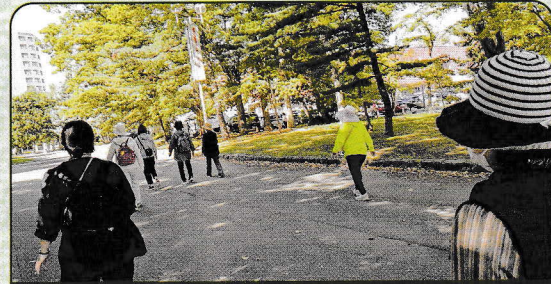
「中島公園ウォーキング」（豊水地区）