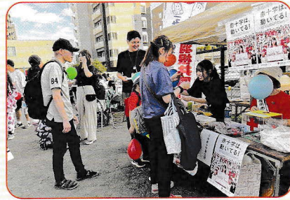
8月10日(日) サマーフェスタ苗穂&子ども盆踊り