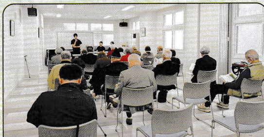
「いきいき健康セミナー」（西創成地区）