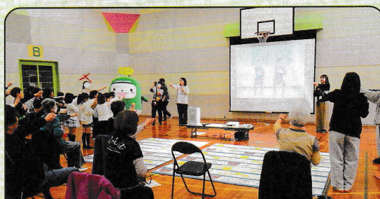
「やまはなハツラツ健康教室」（山鼻地区）