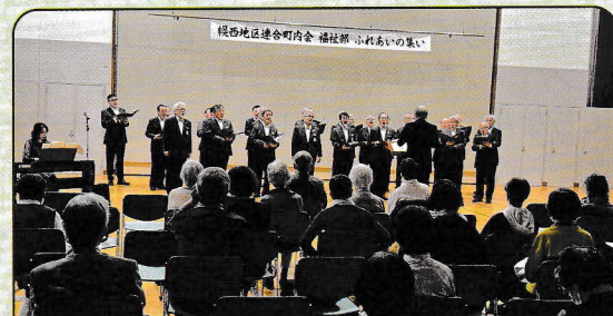
「ふれあいの集い」（幌西地区）