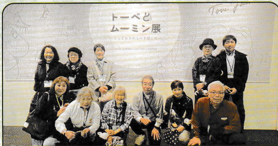
「北海道立近代美術館絵画鑑賞見学会」（中央地区）

恒例行事など様々です。ぜひお近くの行事に参加してみませんか。問い合わせは巻末をご参照ください。