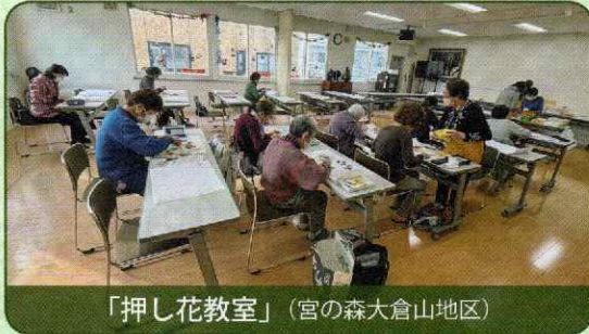
「押し花教室」（宮の森大倉山地区）