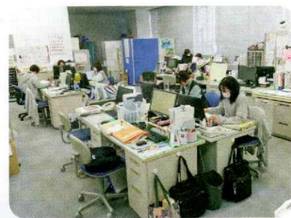
訪問前後の調整を行うヘルパーの皆さん

在籍するホームヘルパーは、定期的な研修などにより知識や技術の向上に日々努め、「住み慣れた自宅で暮らし続けたい」という思いを叶えることをモチベーションとして活動しています!