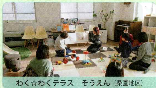
わく☆わくテラス そうえん（桑園地区）