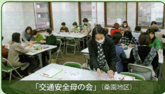
「交通安全母の会」（桑園地区）