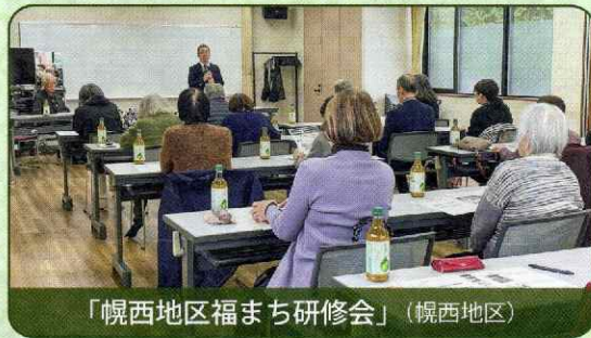
「幌西地区福まち研修会」（幌西地区）