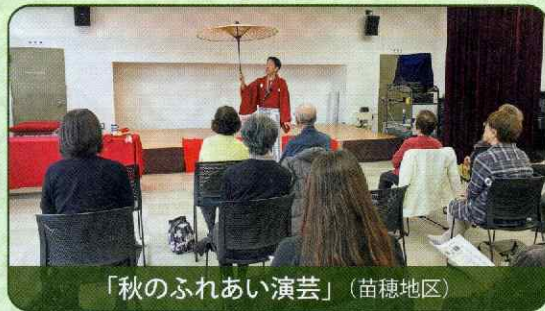
「秋のふれあい演芸」（苗穂地区）