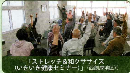
「ストレッチ&和クササイズ （いきいき健康セミナー）」（西創成地区）