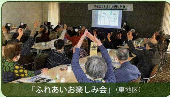
「ふれあいお楽しみ会」（東地区）

前号発行以降開催された各地区の行事を掲載します。（順不同） 恒例行事など様々です。ぜひお近くの行事に参加してみませんか。 問い合わせは巻末をご参照ください。