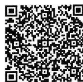
警察庁「自転車ポータルサイト」

南警察署 011-552-0110 幌西交番 011-561-3520 伏見交番 011-551-5474