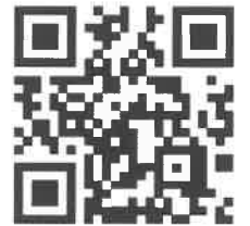
幌西地区連合町内会HP

平成3年から実施してまいりました「幌西夏まつり」も皆さまの温かいご協力によりまして益々の盛況を呈し、今年で34回目を迎えることとなりました。つきましては、下記の通りご案内申し上げますので、皆さまお誘いの上、多数のご来場をお待ちしております。ご家族お揃いでご来場下さいますようお願い申し上げます。